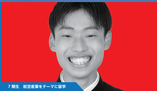
7期生 航空産業をテーマに留学