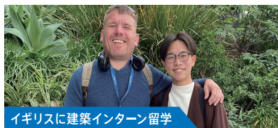
イギリスに建築インターン留学