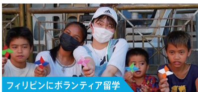
フィリピンにボランティア留学

語学研修と並行し、英国を代表する建築デザイン企業にインターンを行い、フィールドワークを通じて建築の構造とデザインの両面を学びました。