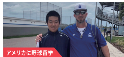
アメリカに野球留学

スラム街でのボランティアプログラムに参加し、子供の食事ケアや、日本の折り紙を教えるなどの異文化交流を通じ、教科書では学べない経験をしました。