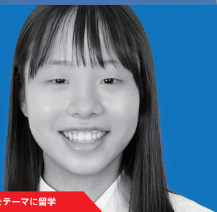
7期生 環境保護をテーマに留学